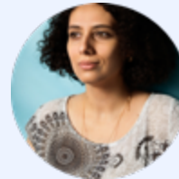
Nada Riyadh MOONBLIND

IN PRODUCTION / PROSPECTIVE PREMIERE 2025